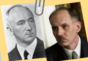
Edvard Beneš (1884-1948)

Na konferenci v Postupimi jednali zástupci vítězné aliance o poválečném uspořádání Evropy. Byl uznán požadavek na odsun Němců z Československa.