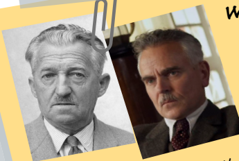
Wenzel Jaksch (1889-1966)